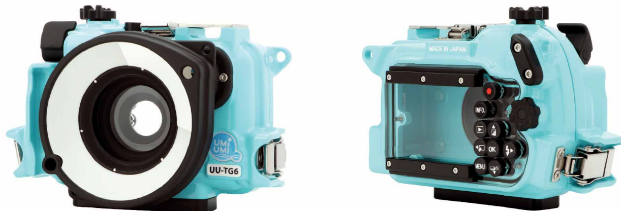
エメラルドグリーン [UU-100503]