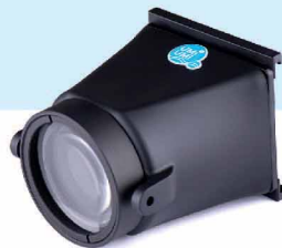
UU-LCDMAX01 水中モニターリングプロ [UU-500101]